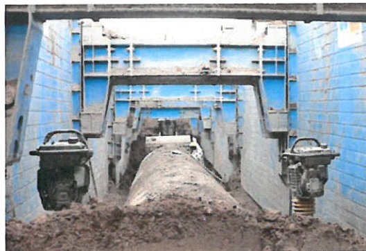
Figura 1 - Escoramento Blindado em galeria de seção retangular Figura 2 - Escoramento Blindado em galeria de seção circular

Vejamos que as galerias apresentadas nas figuras 1 e 2 apresentam execução totalmente dispares da afirmação contida no recurso interposto na sua página quinta: