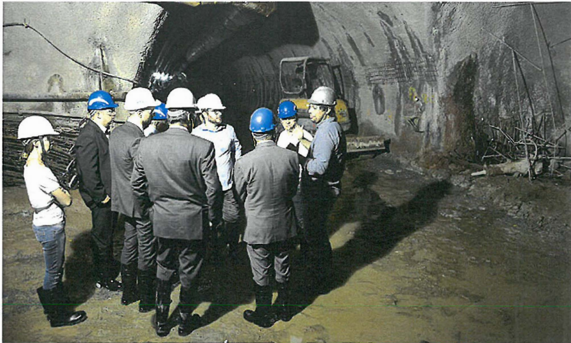
Figura 3 - Execução de galeria pluvial sob a Rua Jurubatuba, São Bernardo do Campo

Alega ainda a recorrente que as tubulações não demandam extenso estudo hidrológico. Desconhece a mesma os motivos de implantação de galerias, como apresentadas nos devidos atestados.